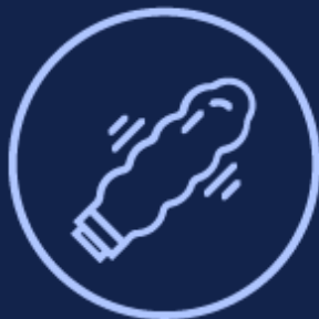
PARTAGE DE OUETS SEXUELS